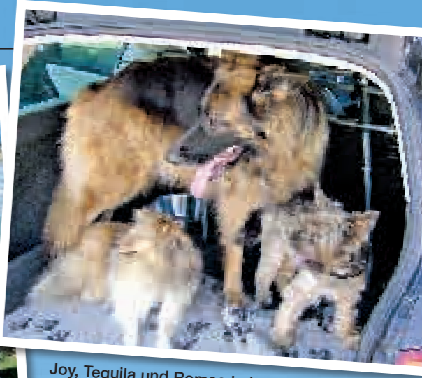
Joy, Tequila und Romeo haben im Familienauto ihr eigenes Reiseabteil

auch das Meer sind sehr sauber! Da die Gegend ein Reisanbaugelände ist, und der Ebro nicht weit, kann es vorteilhaft sein sich abends mit Beginn der Dämmerung für etwa ein, zwei Stunden gegen Stechmücken zu schützen, wenn man sich im Freien aufhält.“