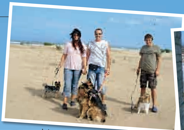
Leinenpflicht gibt es am Strand von Riumar nicht, aber auf Ausflügen waren sie doch dabei

„Riumar ist für uns Ruhe und Erholung pur. Wir können mit unseren Hunden stundenlang am Strand spazieren gehen, oder einfach am Strand relaxen, ohne uns erst mal durch Menschenmassen durchwühlen zu müssen.“ Offiziell gesperrt für Hunde ist nur der bewachte Familien-Badestrand von Riumar, der an den Wochenenden im Juli und August auch von vielen einheimischen Familien genutzt wird. „Aber im Herbst oder Frühjahr können wir auch ohne Bedenken den ganzen Strandbereich nutzen und wirklich stundenlang mit unseren Hunden am Meer laufen und sie frei toben lassen.“ Bevorzugt von Hundefreunden wird die Vor- bzw. Nachsaison auch wegen der durchschnittlichen Temperatur von „nur“ 23–26° C im Schatten. „Der Strand wie