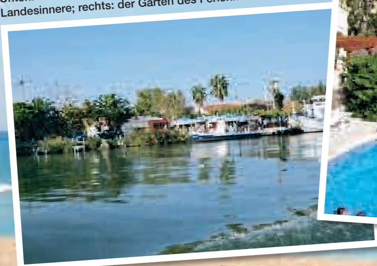
Unten: Der Ebro bietet viele Ausflugsmöglichkeiten ins Landesinnere; rechts: der Garten des Ferienhauses

Ferienhäuser in Riumar buchen Sie über: Deutschlandbüro Hapke Von-Galen-Straße 38 46244 Bottrop-Kirchhellen/Feldhausen Tel. 02045 402930 www.riumar.de