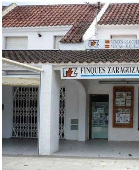
* Notre bureau dans le Centre Commercial *

Appareil pour la navigation: „ Urbanisacion Riumar “